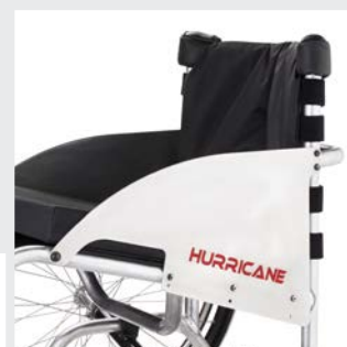
Protège vêtement en aluminium vissés