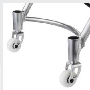
Anti-basculés en standard