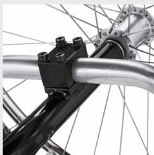
Tube d'essieu surdimensionné pour un réglage idéal du centre de gravité