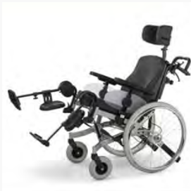
Adaptable à tous points de vue