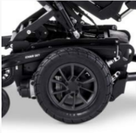
Traction centrale pour une grande maniabilité et des manœuvres précises