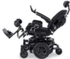
Fonction de mémoire pour enregistrer facilement des séquences de mouvements et des positions souhaitées