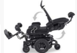
Fonction de couchage avancée avec biomécanique pour les accoudoirs et l'appui-tête