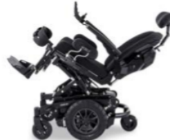
Bords à 40° pour un soulagement efficace de la pression