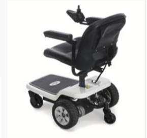
Roues motrices centrales