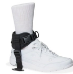
Maintien de cheville