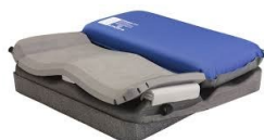
Varilite Pro-Form NX™ 2 compartiments

Pour les utilisateurs de fauteuils roulants ayant des besoins difficiles et asymétriques en matière de protection de la peau, de positionnement et de soutien postural. Modifiable.