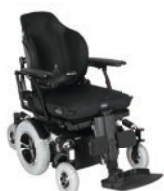
TA iQ MWD 1.518 PAGE 11