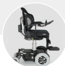
Elévateur d'assise 300 mm