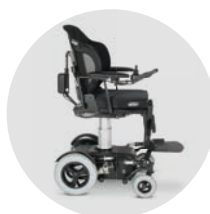
Elévateur d'assise 300 mm