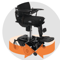
Rayon de braquage minimal 450 mm