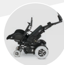
Réglage électrique de l'angle d'assise