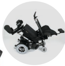
Fonction de couchage

+ SUSPENSION INDÉPENDANTE À RESSORTS POUR UNE TRACTION OPTIMALE