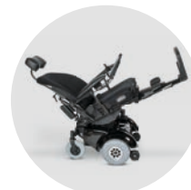
Inclinaison de 45° avec dossier biomécanique et repose-pieds (en option)