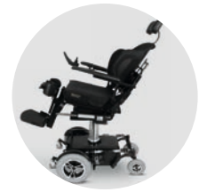
Inclinaison de l'assise 45° avec élévateur d'assise