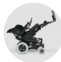
Réglage électrique de l'angle d'assise 45°