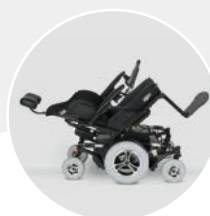
Réglage électrique de l'angle d'assise 45°