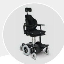
Elévateur d'assise 300 mm

+ SUSPENSION INDÉPENDANTE À RESSORTS POUR UNE TRACTION OPTIMALE