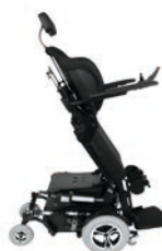
TA iQ FWD Stand-Up 1.520 PAGE 10